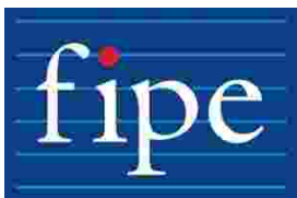
Tabela Fipe tem valores para negociar carro, moto e caminhão

Carga solta aumenta perigo para quem viaja de moto; saiba evitar